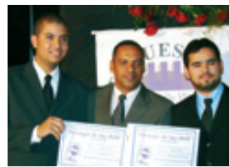
NEW VISION Recarga de Cartuchos Praça Afrânio Melo Franco (38) 3671 7141