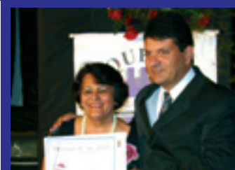
AMNOR Associação Regional