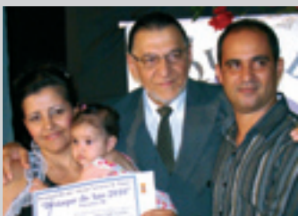
QUASE TUDO LANCHES Lanchonete Av. Olegário Maciel, 616 (38) 3671 6560