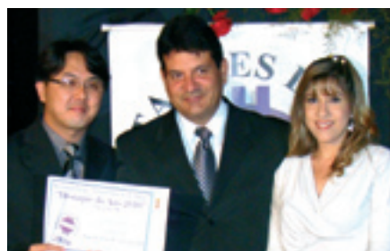
CAFÉ TRÊS GERAÇÕES Torrefação de Café Av. Brasília 365 (38) 3671 6857