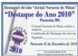
RÁDIO JURITI AM Radio AM Rua Alexandre Silva, 295 (38) 3671 3047

Rua Antônio Vieira Cordeiro, 520 B. Bela Vista