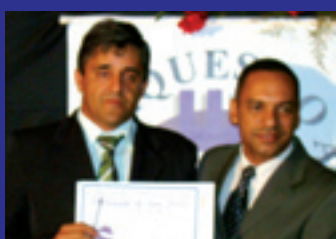
CLÍNICA VETERINÁRIA RS VET Clínica Veterinária Rua Joaquim Murinho, 508 (38) 3671 6364