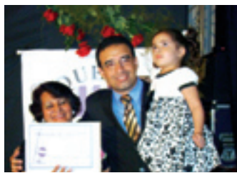
MULTITECH Escola de informática Av. Dep. Quintino Vargas 32 2º andar (38) 3671 5010