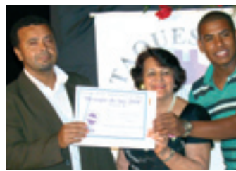
ESTRUTURAS MET. E SERR. ELO FORTE Serralheria Rua Waldemar Botelho, 349 (38) 3671 2745