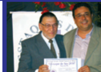
ELETRO NEIVA Materiais Elétricos Rua Josino Valadares, 131 (38) 3671 1435