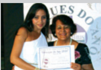
OUSADIA SHOP Loja de Departamento Dep. Quintino Vargas, 426 (38) 3761 3166