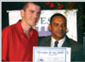
MULTI OI Venda de Celulares Av. Olegário Maciel, 530 (38) 3672 6000