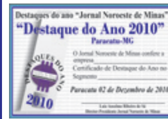
DJ TONY DJ