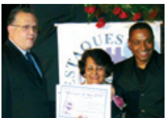
CAIXA ECONÔMICA FEDERAL Instituição Financeira Praça Firmino Santana (38) 3311 4100