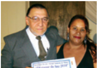
BAIA CONFECÇÕES Confecção de Uniformes Rua Eduardo Pimentel, 240 (38) 3672 1220