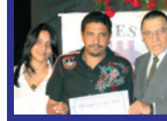
VIDROMINAS Vidraçaria Av. Romualdo Ulhoa Tomba, 137 (38) 3671 4112