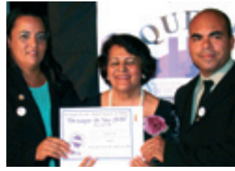
SÔNIA FESTAS Buffet Rua Goiás, 330 (38) 3671 5833