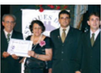
RSJ CONSTRUTORA Construtora Rua Dom Serafim, 465 (38) 3671 2119