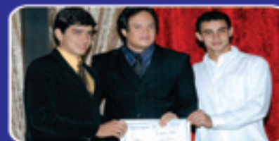
Destaque do Ano 2010 do Jornal Noroeste de Minas em Unai

OS proprietários e funcionários da RETIFICA MOTORFORTE, vem a publico agradecer pelo reconhecimento em pesquisa de opinião publica, pelas indicações como Destaque do Ano do Jornal Noroeste de Minas em Unai e Paracatu, e pelo Mérito Empresarial realizado pela ACIU.