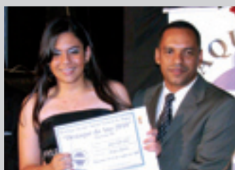
QUASE TUDO BABY Artigos Infantis Rua Joaquim Murinho, 21 (38) 3671 9262