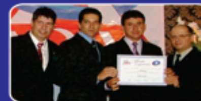
Mérito Empresarial ACIU em Unai