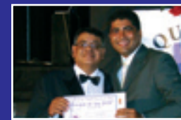
JORNAL VISÃO REGIONAL Jornal Impresso