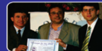
Destaque do Ano 2010 do Jornal Noroeste de Minas em Paracatu