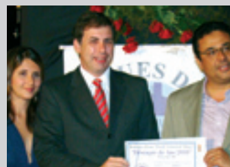
KINROSS Parceria com a comunidade