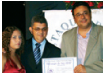
GRÁFICA E EDITORA MORRO DO OURO Gráfica e Editora Rua Getúlio de Melo Franco (38) 3671 6311