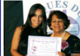
BIDA sonorização e iluminação de eventos