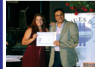
VIA MULHER Programa Feminino TV Rio Preto