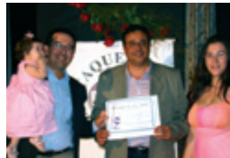
ÓTICA FELIZ Ótica Rua José Pereira Guimarães (38) 3672 2444