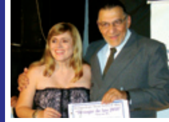
TVP TV PARACATU Televisão Rua Joaquim Murinho, 235 2º andar (38) 3671 3125