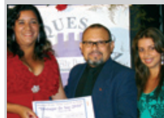
LENE CHECK LINE CARD Cartão de Crédito Rua Goiás, 334 (38) (38) 3671 5055