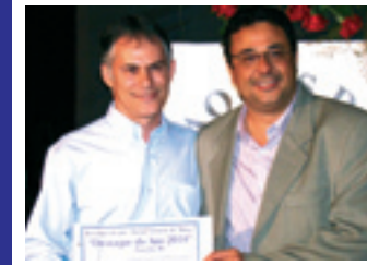
SICOOB CREDIPARNOR Cooperativa de Crédito Av. Dep. Quintino Vargas, 434 (38) 3671 5755