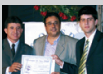
RETIFICA MOTORFORTE Retifica de Motores Rua Antônio Vieira Cordeiro, 520 (38) 3672 4080