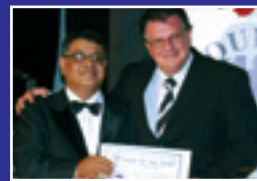
REPR. ANTÔNIO ANDRADE Deputado Federal