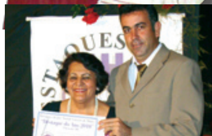
PRIMAVERIA VEÍCULOS Concessionária de Veículos BR 040, 1851 Km 43,5 (38) 3311 4000