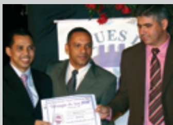
HIPERMERCADO BRETAS Hipermercado