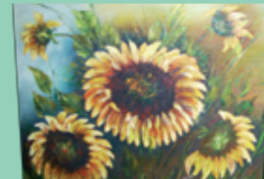
Associação dos Artesãos de Unaí