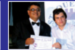
JORNALDINÂMICO Jornal impresso