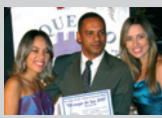
LENE CLÍNICA Clinica Medica Rua Samuel Rocha, 230 (38) (38) 3671 5055