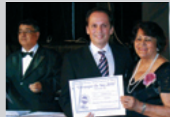
PARACATUNET Portal de internet www.paracatu.net