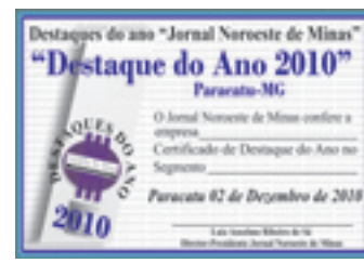
FILTRO ÓLEO Comercio de Lubrificantes Rua Major Aristides Lopes, 100 (38) 3671 3311