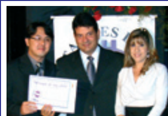
CAFÉ TRÊS GERAÇÕES Torrefação de Café Av. Brasília 365 (38) 3671 6857