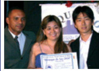
UNITEC Cursos Técnicos Rua Dom Pedro I, 172 (38) 3671 4710