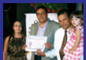
CABANA PISOS Acabamentos para Construção Av. Olegário Maciel, 135 (38) 3671 3000