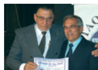
MARTAN MÓVEIS E DECORAÇÃO Loja de móveis e decoração Rua Goiás, 305 / Rua Joaquim M., 515 (38) 3672 1475