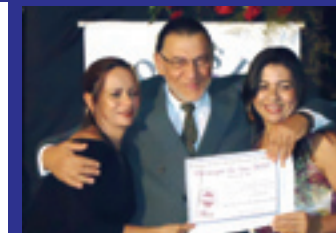
CONTABILIDADE NOVAES PINTO Contabilidade Rua Tupi, 66 (38) 3671 1578