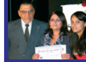
SORVETERIA TROPICAL Sorveteria Rua Getúlio de Melo Franco, 98 (38) 3671 2496