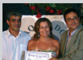
MINAS EXTINTORES Venda de Extintores Rua Caetano Silva Neiva, 34 (38) 3671 4254