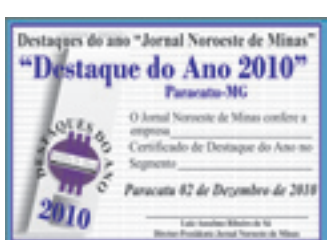
RÁDIO JURITI AM Radio AM Rua Alexandre Silva, 295 (38) 3671 3047