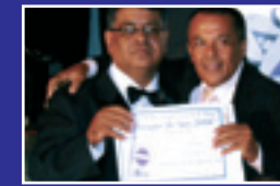
O MOVIMENTO Jornal impresso