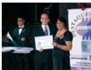
PAPELARIA EXATA Papelaria Av. Olegário Maciel (38) 3671 2233