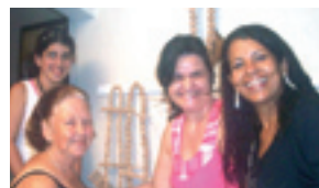
Na ocasião foi assinada uma parceria entre o Museu e a Emater-Unaí, a qualificando a garimpar acervo para o Museu, em toda sua área de atuação