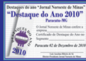
CYBER STÚDIO Comunicação Visual Rua O. de Melo, 86 (38) 3671 5299