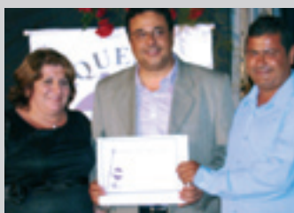
PIZZARIA GAÚCHA Pizzaria Rua Dom Elizeu, 521 (38) 3671 3645