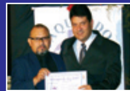
VASCO PRAÇA FILHO Prefeito de Paracatu