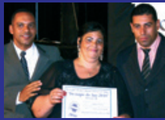
SOLANO TEIXEIRA COMUNICAÇÕES Sonorização Volante Praça Firmino Santana, 379