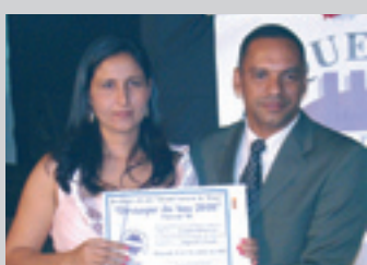
LOCALIZA RENT CAR Locação de Veículos Rua Padre Manoel, 298 (38) 3671 6131