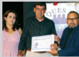
FUNERÁRIA SÃO PEDRO Funerária Rua Martins Mundim, 05 (38) 3671 4373