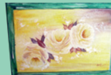
Alunos do CEPASA