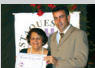
PRIMAVERIA VEÍCULOS Concessionária de Veículos BR 040, 1851 Km 43,5 (38) 3311 4000