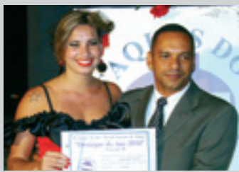
EMANUELLE MORAES Cantora