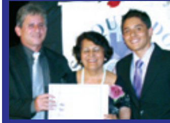
UNIÃO BATERIAS Venda de Baterias Rua Caetano Silva Neiva, 02 (38) 3671 2160