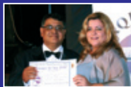
REVISTA VITRINE Revista impressa