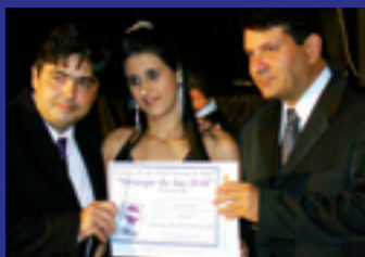
ALOHA BOUTIQUE Boutique Av. Olegário Maciel, 567 lj 04 (38) 3672 3439