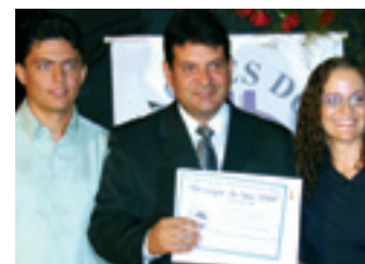
LÚ ESTÉTICA Estética feminina Rua Otaciano de Melo, 103 (38) 3671 4558