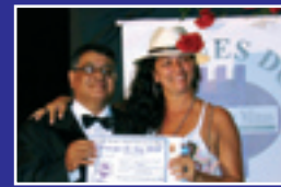
OLÁBARO Jornal impresso