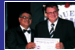
JORNAL DA COOPERVAP Jornal impresso