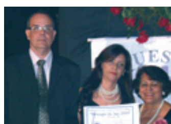
LOCADORA VÍDEO MINAS Locadora de Vídeo Praça Juquita Vargas (38) 3671 2446