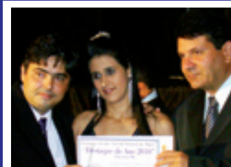
APLIQUE Prod. de Limp. e mat. descartáveis Rua Dom Elizeu 485 (38) 3671 6099 / 3671 4506