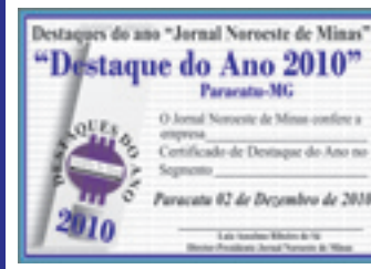
SALES JALES Pecuarista