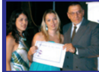
SESC LACES PARACATU Promoção de eventos culturais Rua Eurídamas A. de Barros, 34 (38) 3672 1385