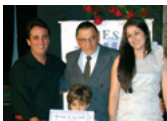
PNEUMINAS PARACATU Recapagem Rua Caetano Silva Neiva, 212 (38) 3672 6900