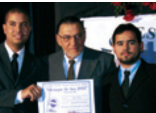
NEW VISION Tecnologia Voip Praça Afrânio Melo Franco (38) 3671 7141