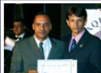
AUTO ESCOLA MAIA Auto Escola Rua Getúlio de M. Franco, 316 (38) 3671 4921