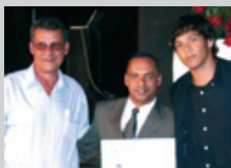
PARACATU MADEIRAS Madeiraira Rua Porto Buriti, 300 (38) 3671 1226 / 3672 5500