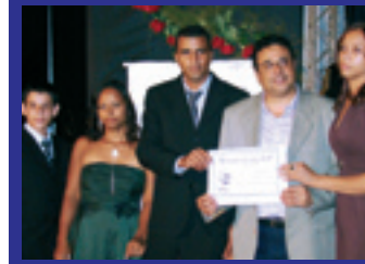
SEGURANÇA TOTAL Segurança do Trabalho Av. Olegário Maciel 1250 (38) 3672 4323