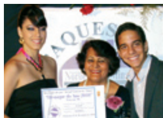
IMOBILIÁRIA ASSIMOB Imobiliária Rua Paulo Danilo Pena, 109 (38) 3671 3900