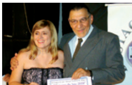
TVP TV PARACATU Televisão Rua Joaquim Murinho, 235 2º andar (38) 3671 3125