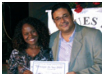
PROGRAMA AGRO MAIS Programa rural