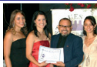
CASA MOURA Cama, mesa e banho Rua Deputado Quintino Vargas, 240 (38) 3671 7989