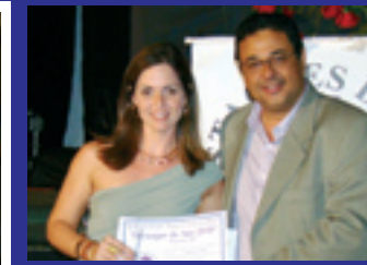
ACADEMIA CORPUS Academia Rua Dr. Seabra, 295 (38) 3671 3300