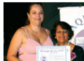
LENE MONITORAMENTO Segurança Eletrônica Rua Dr. Rubens Bitencourt, 200 (38) (38) 3671 5055